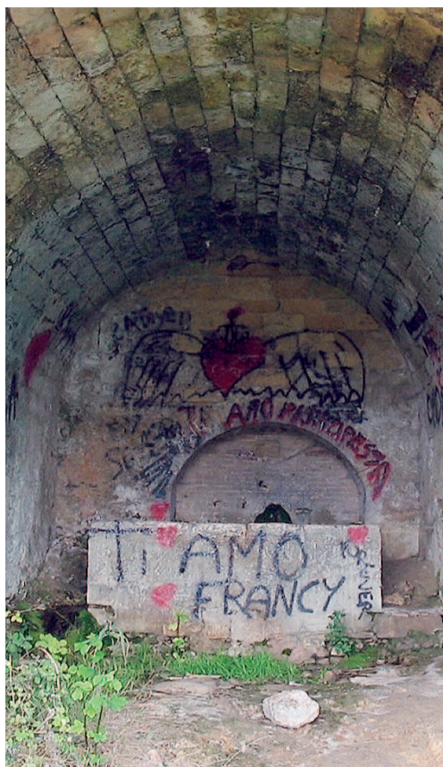
DA RECUPERARE La fonte di San Ruggiero

Il progetto si propone in effetti l'obiettivo di rendere gli alunni protagonisti di un laboratorio di ricerca-azione territoriale per l'apprendimento di una didattica